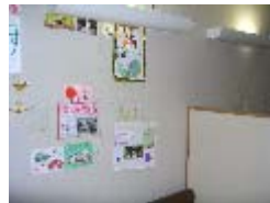
【居室には思い出の作品が飾ってある】