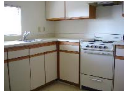
【広いタイプの居室の様子】