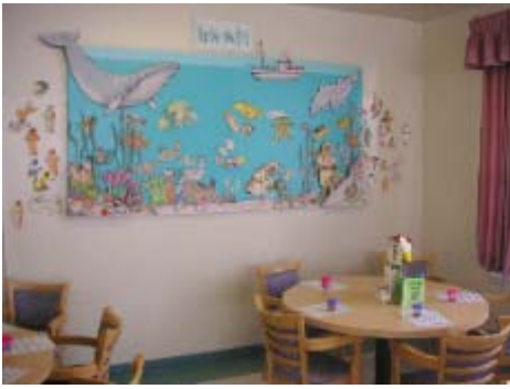
【アクティビティールーム】