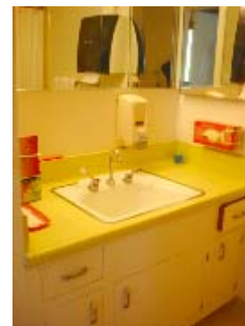
【Skilled Nursing の居室】

Skilled Nursing 内には教会があり、自由にお祈りを出来るようになっている。