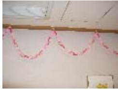
【壁には利用者が作成した作品が広がる。】