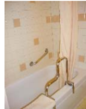
【RETIREMENT HOME のお風呂】