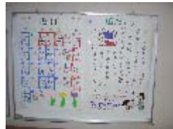
【職員が作成した作品】