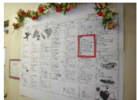
【ICF 内に掲示されている アクティビティーカレンダー】